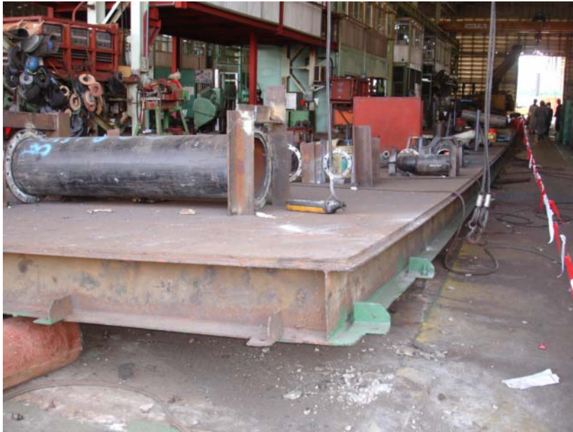
รูปที่ 3 ในภาพความเสียหายของ Platform หลังจากเกิดระเบิด มุมด้านขวาที่ยกขึ้น เป็นการยกขึ้น โดยใช้ Crane ยกเพื่อระบายก๊าซ C_2H_2 ที่อาจตกค้างใต้ Platform