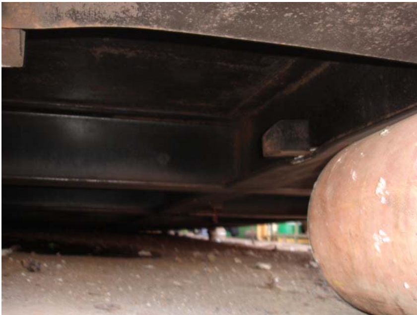
รูปที่ 7 ภาพช่องว่างทางด้านล่าง ของ Platform ที่เกิดการสะสม ของก๊าซอะเซทิลีนที่เกิดเหตุ