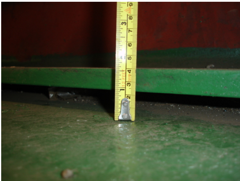
รูปที่ 4 แสดงระยะระหว่างฐานของ Platform กับพื้น คสล.