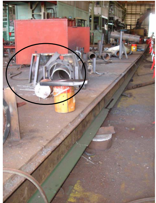
รูปที่ 6 ภาพแสดงอุปกรณ์และชิ้นงานที่ช่างเชื่อม ทำการเชื่อมบนPlatform