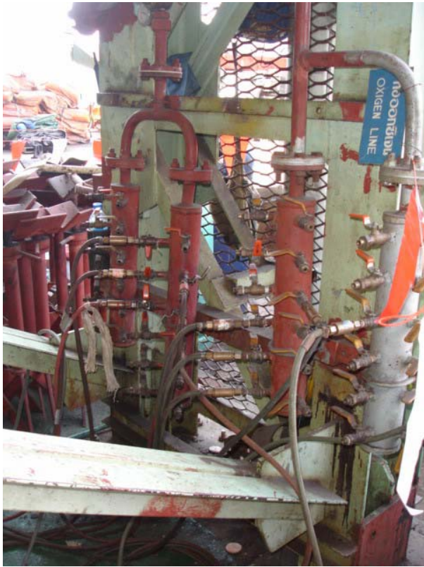
รูปที่ 5 Header ด้านซ้ายเป็นก๊าซอะเซทิลีน 2 Headers และ Header ด้านขวาเป็นก๊าซ อ็อกซิเจน 2 Headers